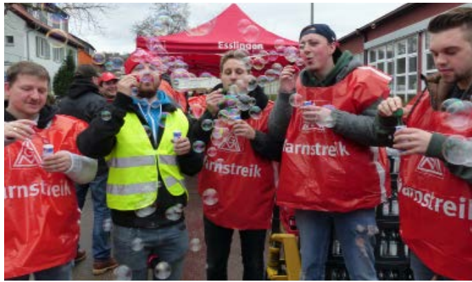
Die Puste hat sich gelohnt: Jugend-Aktion bei Index in Esslingen

Materiell haben wir ein gutes Ergebnis geschafft und die qualitativen Themen, die wir uns vorgenommen haben, sind